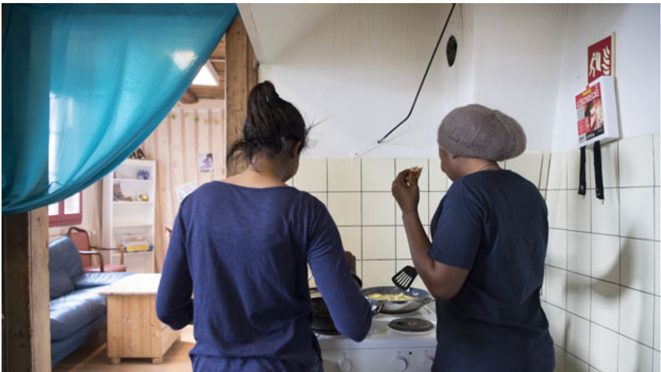
Bildlegende: Zwei Asylsuchende kochen in der Asylunterkunft in Moosseedorf.

Je länger Migrantinnen und Migranten in der Schweiz sind, desto besser sind sie in den Arbeitsmarkt und ins soziale Leben integriert. Das zeigt das neuste Migrations-Panorama. Punkto Einkommen und Vermögen bleiben allerdings gewisse Unterschiede bestehen.