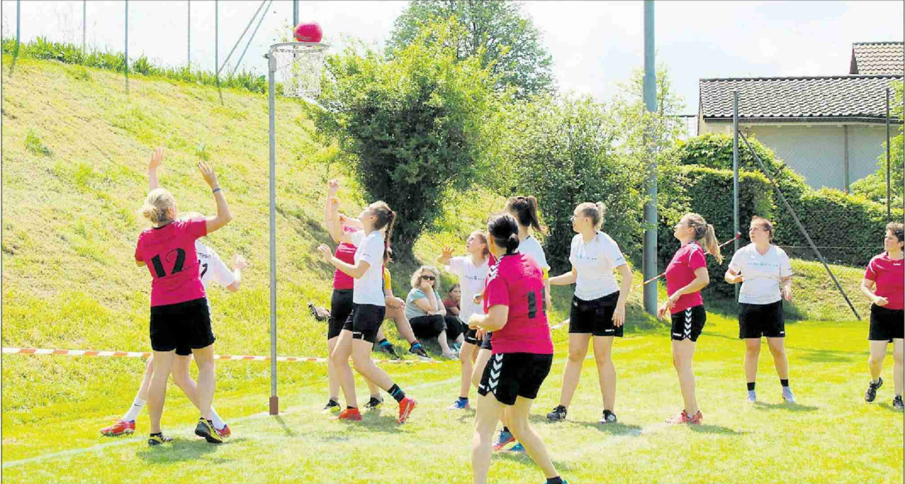
Escholzmatt im pinken Dress beim erfolgreichen Korbwurf gegen Urtenen. [Bild zVg]