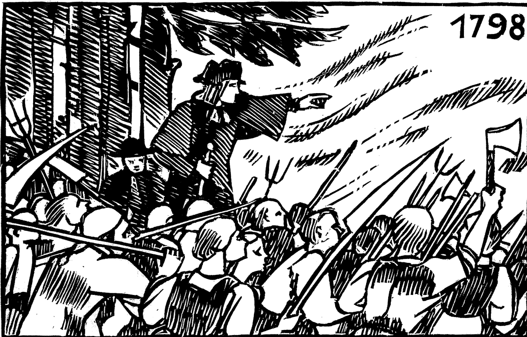
Kämpfe im Grauholz 1798

Als die Sonne sich in seltener Pracht er-