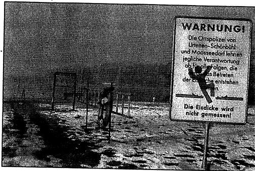
Im Strandbad Moossee warnt eine Tafel vor dem Betreten der Eisfläche.

Die Ortspolizei von Urtenen-Schönbühl und Moosseedorf haben beim Strandbad Moossee und dem Restaurant Seerose Warn- tafeln aufgestellt. Das Betreten der Eisfläche erfolgt auf eigene Ge-