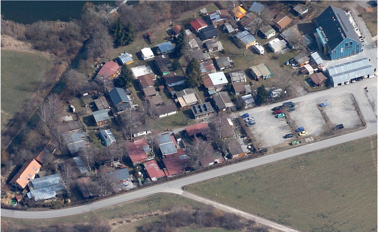
Luftbild Camping Seerosee (2013)